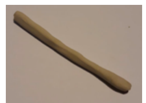
Immagini: esperimenti su forme diverse con l'argilla